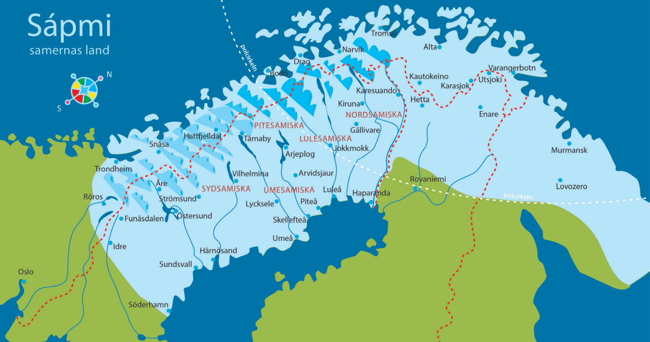
Karta Samiskt informationscentrum. Ill.: Anders Suneson