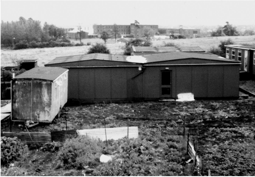
En begagnad barack på en leråker. Den iriskspråkiga skolan i Belfast 1980.

Vid den tiden var det högst osannolikt att några protestantiska barn skulle börja i skolan. Året före hade nästan 500 människor dödats i oroligheter där fiendskap mellan katoliker och protestanter var ett starkt inslag. Den här inkluderande andan finns fortfarande kvar i det iriskspråkiga skolväsendet. Visserligen sker en stor andel av all iriskspråkig undervisning inom den katolska sektorn, men majoriteten av de elever som får sin undervisning på iriska finns i skolor som inte är en del av det katolska systemet, även om det absoluta flertalet av eleverna än idag har katolsk bakgrund.