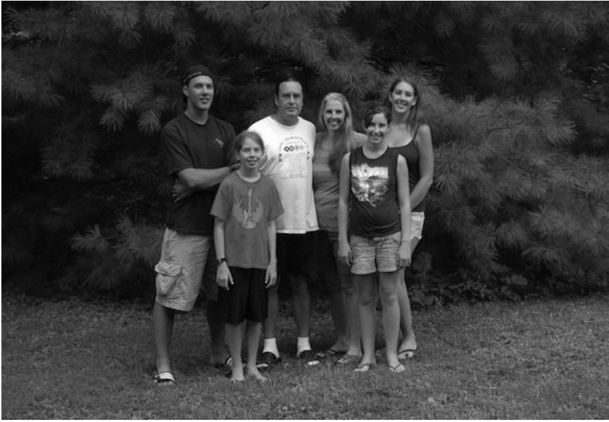
weecikiintiaanki (vår familj).

Min släkt splittrades när vårt folk år 1846 tvångsförflyttades från sitt ursprungliga område i norra delen av centrala Indiana till ett reservat i det som senare kom att bli Kansas. På 1870-talet förflyttades vår släkt igen, den här gången till "Indianterritoriet" (Oklahoma). En del av mina förfäder stannade i Kansas och andra blev kvar i Indiana och nordvästra Ohio. Genom dessa tvångsförflyttningar har myaamiafolket alltså spridits över Indiana, Kansas och Oklahoma, och idag är nästan varje myaamiasläkt utspridd över de tre staterna. Vårt folks marker är ett splittrat lapptäcke på ungefär 534 hektar, främst i vårt jurisdiktionsområde i Ottawa County i nordöstra Oklahoma. Miami-stammen i Oklahoma är en federalt erkänd stam med 3700 personer i sin medborgarlängd men det finns säkert dubbelt så många personer i Mellanvästern som har myaamiaursprung.