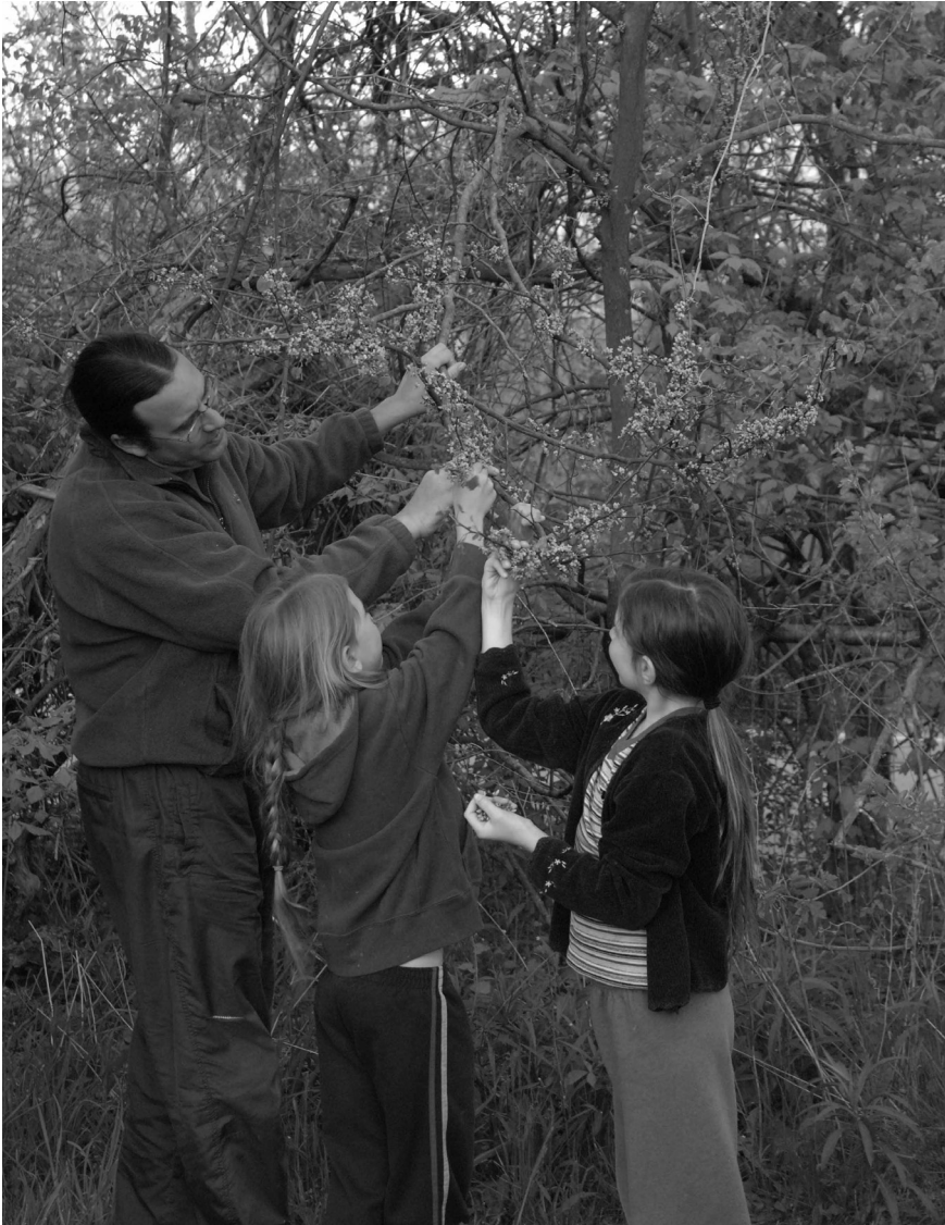
meehkintaminki eeyoonsaaweekiša peehkateekia meeloohkamike (vi plockar judasträdets blommor om våren).