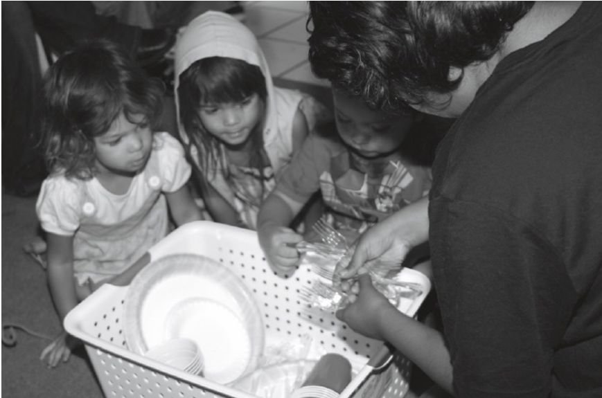
Barnen lär sig vardagskawaiisu.