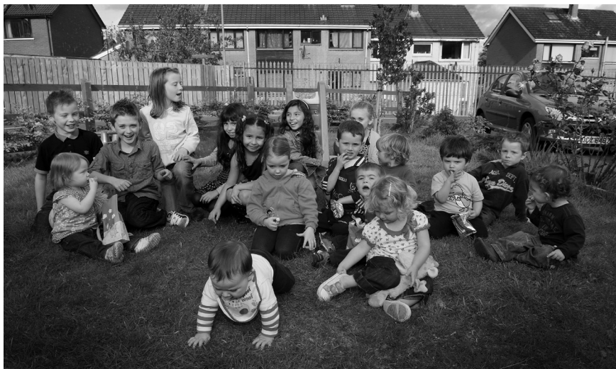
Barn i det irisktalande området på Shaw's Road i Belfast i Nordirland.

de uttryck han använde. Hans mamma, som hade varit mest negativ till att prata mohawk när hon själv var liten, pratade nu bara det språket med honom. Hans moster Kawennahén:te och hans morbror Nihahsennà:a pratade bara mohawk med honom.